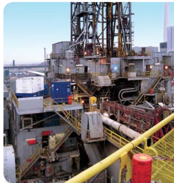
Der FMC 2000 Controller kann auf Bohrinseln verwendet werden